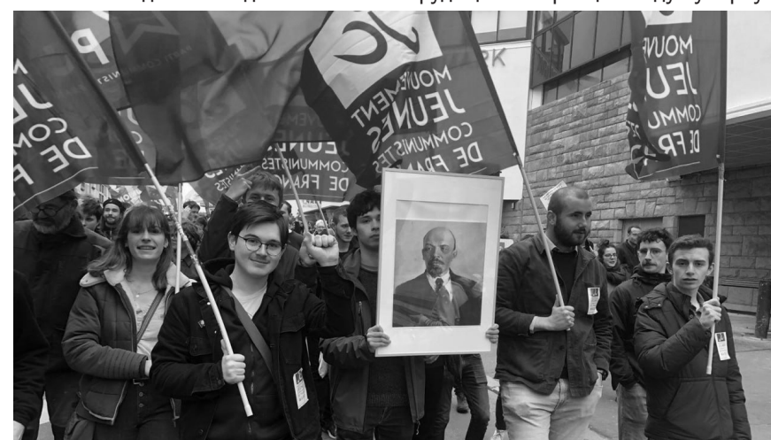
В.И. Ленин шагает в колонне демонстрантов против пенсионной реформы во французском г. Бресте - 28.03.2023.

можно. В этой связи в странах Запада были созданы сотни институтов для разработки планов и программ по уничтожению и искоренению любых сил, стремящихся к социальной справедливости, социализму и дружбе народов. При этом главный удар предполагалось нанести по СССР и мировому коммунистическому движению. В ход были пущены идеи неомарксизма, еврокоммунизма, неотроцкизма, началась фальсификация истории СССР и ВМВ, высмеивался пролетарский интернационализм и дружба между народами. Одновременно началась подготовка кадров для будущих майданов и «цветных революций». Силы контрреволюции под видом демократии упорно вдалбливали через СМИ идеи потребительства, наживы и личного успеха через занятие бизнесом, презрение к национальным меньшинствам, воспевая успехи богатой элиты западных стран. А дальше пошли в ход откровенно шовинистические и фашистские идеи о сокращении численности населения Земного шара до 1 млрд. человек, создания цифрового концлагеря и биологического оружия, перехода к культуре ЛГБТ и т.д.