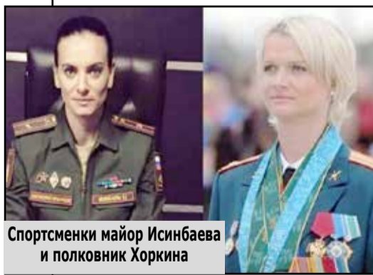
Спортсменки майор Исинабаева и полковник Хоркина

Министр спорта России Олег Матыцин, обращаясь к сборной России, участвующей в Играх стран СНГ, заявил, что недружественных стран для российских спортсменов нет, они, мол, «всегда открыты по отношению к другим». То есть, пусть что хотят Запад, США, «международные спортивные организации» типа МОК – то и делают.