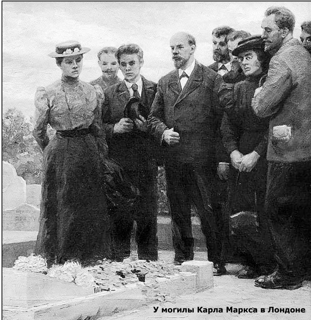
У могилы Карла Маркса в Лондоне