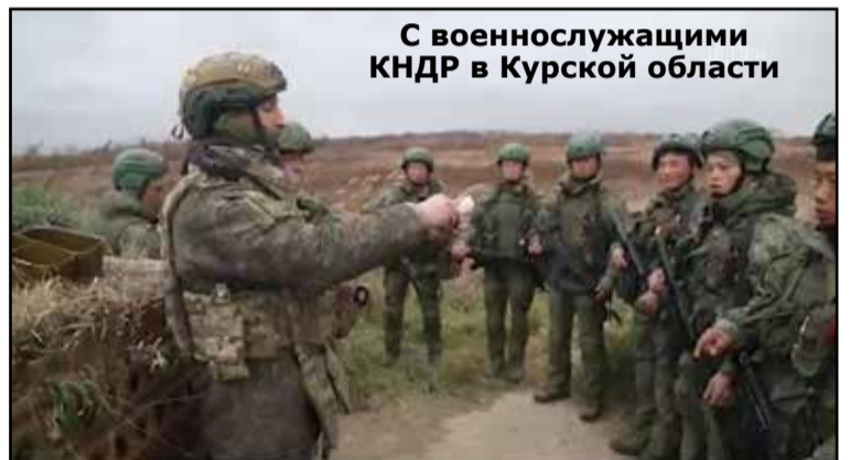
С военнослужащими КНДР в Курской области

Женщина пострадала в Новой Каховке Херсонской области в результате атаки вооружённых формирований Украины (ВФУ). Об этом 28 апреля сообщил губернатор региона Владимир Васильевич Сальдо. Он добавил, что ВФУ также обстреляли такие населённые пункты, как Алёшки, Каховка, Голая Пристань, Днепрятны, Казачьи Лагеря, Новая Маячка и Малая Лепетиха.